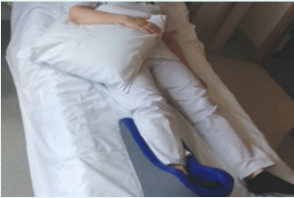
Soutien de la jambe avec « Gouttière »